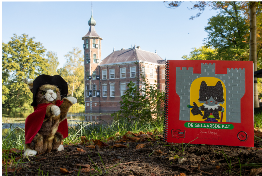
Figuur 6 De gelaarsde kat , oktober 2022

Dankzij de Franse uitgever Bayard heeft PrentenboekenPlus de licenties voor de bewerking van drie bekende sprookjesprentenboeken gekregen. De bewerking van de eerste titel, De gelaarsde kat , werd in oktober 2022 afgerond. Diverse andere titels zijn op dit moment in ontwikkeling.