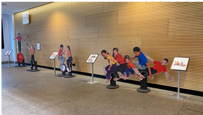
Figuur 4 De tentoonstelling in het Stadskantoor van Utrecht

In de maanden oktober en november heeft PrentenboekenPlus een tentoonstelling georganiseerd in zowel het Stadhuis als het Stadskantoor in Utrecht. Uitgangspunt voor de tentoonstelling waren de circusacts van het Utrechtse kindercircus DIEDOM. Voor dat Corona uitbrak hebben kinderen van dit circus hun kunsten vertoond, zijn gefotografeerd en hebben bij iedere act hun verhaal verteld. Door middel van een QRcode kan de lezer, hun verhaal beluisteren. Door middel van deze tentoonstellingen heeft een breed publiek kennisgemaakt met tactiele figuren.