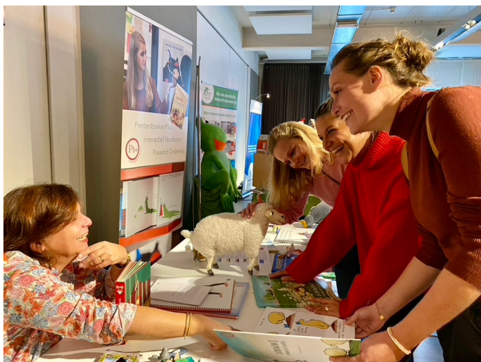
Figuur 3 Landelijk Congres 'Het Jonge Kind', september 2022

PrentenboekenPlus zet zich in om de taalontwikkeling en het taalbegrip bij kinderen met een communicatieve beperking te vergroten. Dit doen we omdat we vinden dat niet één kind mag achterblijven in onze samenleving. Naast alle digitale kanalen ontplooit PrentenboekenPlus allerlei activiteiten om meer bekendheid aan de prentenboeken te geven.