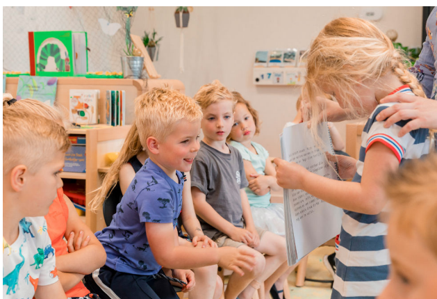
Figuur 7 De klas rondgaan om aan je klasgenootjes de illustraties te laten zien.

Tegelijkertijd zorgt dit ervoor dat onze logistieke service ook minder onnodig belast wordt.