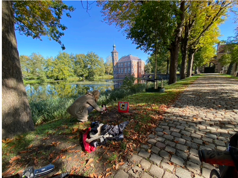
Figuur 8 Ook fotografie is een onderdeel van het ontwikkeltraject.