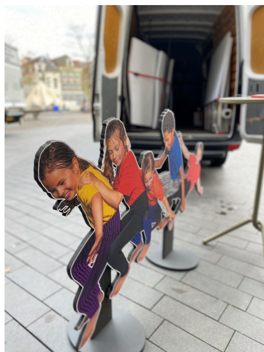
Figuur 5 De verhuizing van de tentoonstelling van het Stadhuis van Utrecht naar het Stadskantoor.