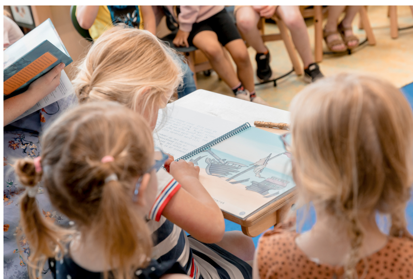
Figuur 1 Het boek verkennen en zelf al wat lezen