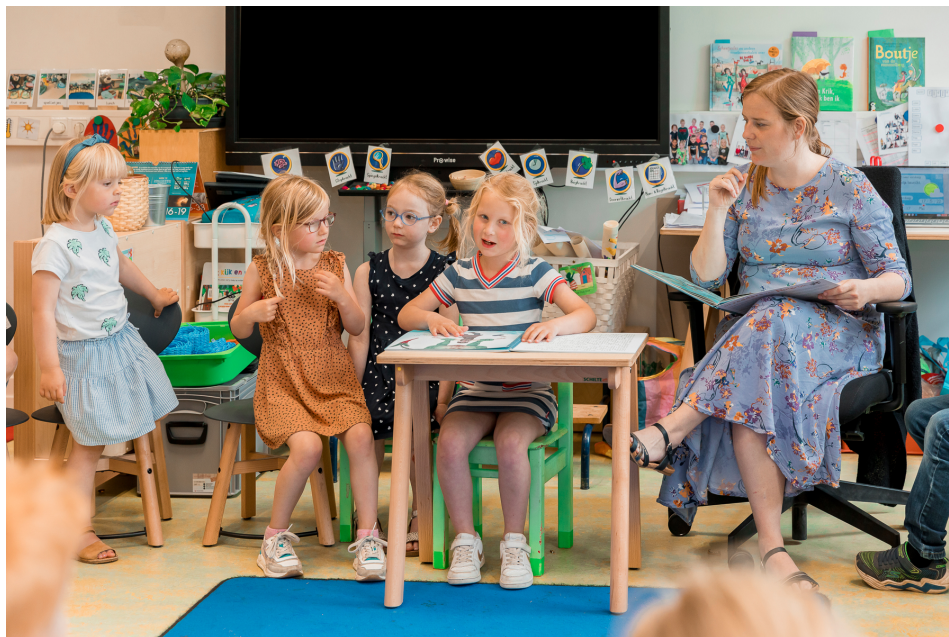
Figuur 2 Direct aan de slag met het boek!

Kinderen met een visuele, auditieve of andere communicatieve beperking kunnen verschillende problemen ervaren wanneer zij samen met een volwassene een prentenboek lezen. Om helpend te zijn bij het ondervangen van die problemen wordt voor ieder prentenboek een handleiding geschreven met daarin didactische en pedagogische aanwijzingen. Door andere perspectieven in de verhalen aan te wijzen, maar ook door de voelbare illustraties, worden de kinderen geprikkeld en komt communicatie op gang. Een prentenboekenset bestaat uit een regulier prentenboek, een tactiel prentenboek met braille, een voorwerp zoals een knuffel, en een handleiding voor de professional.