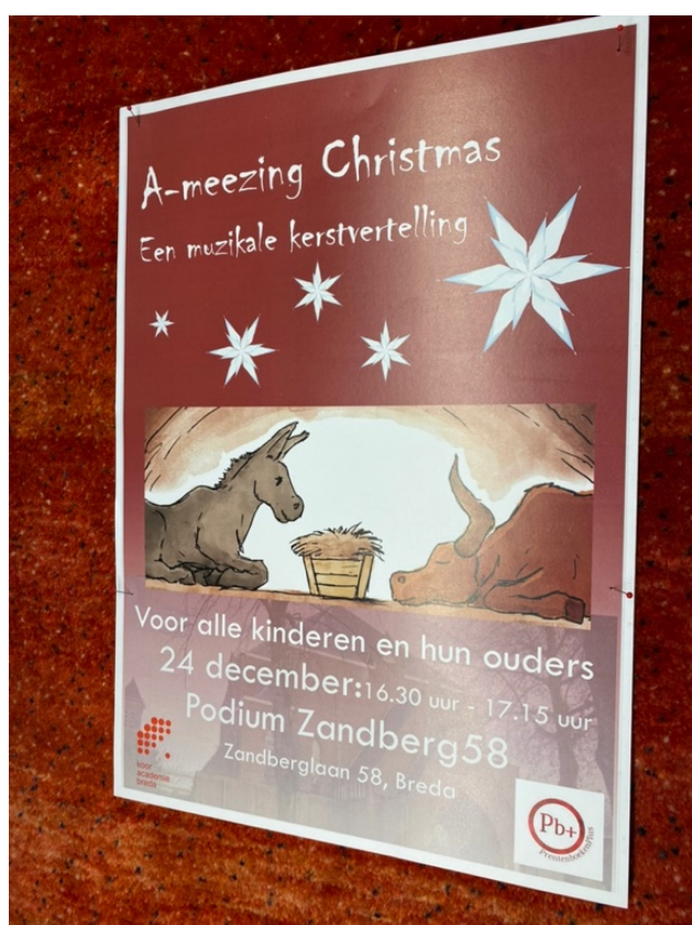
Aankondiging Mee-zing Christmas