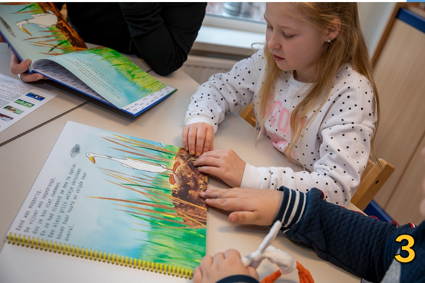
Samen een boek bewonderen