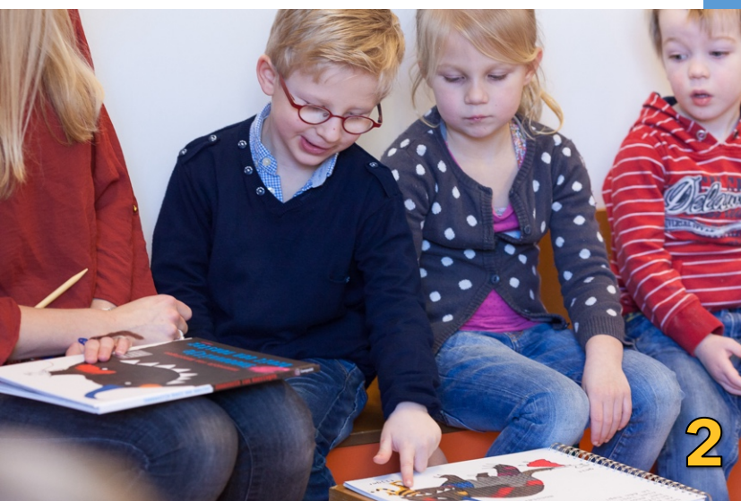
Actief deelnemen in de kring